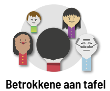
Betrokkene aan tafel